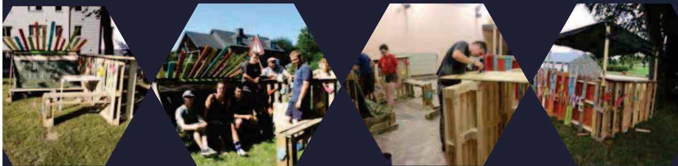
MOBILIER RÉALISÉ LORS DE LA PREMIÈRE ÉDITION ET PLACÉ À TRANSINNE ET LIBRAMONT

Une organisation du GAL Nov'Ardenne en collaboration avec la Maison de Jeunes de Saint-Hubert