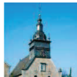
Opération Pièces Rouges